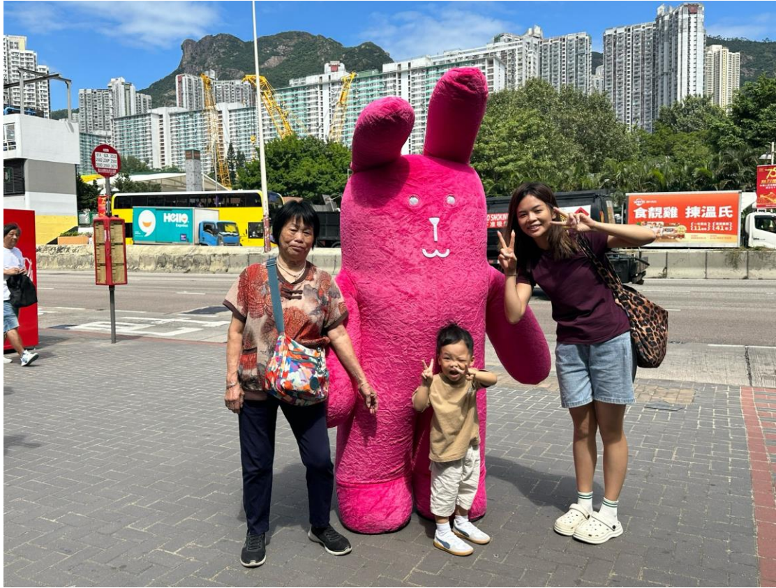
賣旗主角Craftholic®宇宙人到黃大仙地鐵站外快閃，吸引不少人和一家大小買旗和打卡拍照留念。